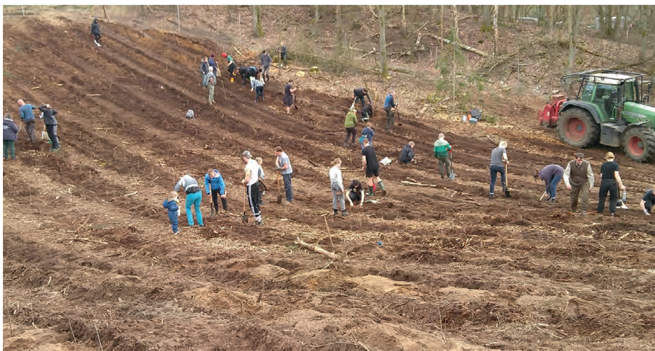
6000 Bäume pflanzten Teilnehmer eines Klimacamps in einem Waldstück bei Dargelütz.