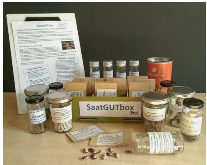
Auch das Diakonische Werk beteiligt sich am Projekt Saatgutbox.

Unter dem Motto „Schätze bergen!“ fand in Kooperation mit dem Zentrum für kirchliche Dienste für die diakonischen Einrichtungen der erste Fachtag zum Thema Nachhaltigkeit statt. Neben den Impulsvorträgen zu den Themen Fördermittelvergabe und Nachhaltigkeitsberichterstattung stand besonders der Austausch im Mittelpunkt des Treffens. Aufgrund der hohen Resonanz und gezielter Themenwünschen der Teilnehmenden werden in 2024 weitere Fachtage zum Thema Nachhaltigkeit für diakonische Einrichtungen und Kirchengemeinden in Mecklenburg-Vorpommern folgen.