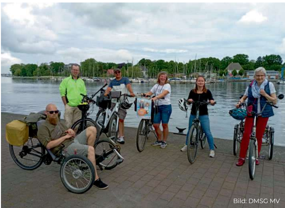
Teilnehmende der Fahrradtour zum Welt-MS-Tag 2024

Im November 2024 initiierten wir erstmalig ein vielfältiges Programm aus kostenlosen Online-Veranstaltungen rund um das Leben mit MS. Zum Auftakt gab es hilfreiche Informationen und Übungsbeispiele zur logopädischen Intervention sowie Entspannungstechniken. Es folgten aufschlussreiche Vorträge zum Schwerbehindertenantrag, zum (komplexen) Persönlichen Budget, zu Kranken- und Arbeitslosengeld sowie zur EU-Rente. Außerdem gab es wertvolle Tipps zum Erstellen einer Patientenverfügung und Vorsorgevollmacht. Individuelle Fragen konnten verständlich beantwortet werden. Zusätzlich gab es zwei Gesprächsrunden mit unseren ehrenamtlichen Betroffenen und Angehörigen, die dem Erfahrungsaustausch und als Impulsgeber dienten. Abgerundet wurde die Woche mit Dr. Sabine Schipper, die als Psychologin Wege zu einer glücklichen Partnerschaft bei MS aufgezeigt.