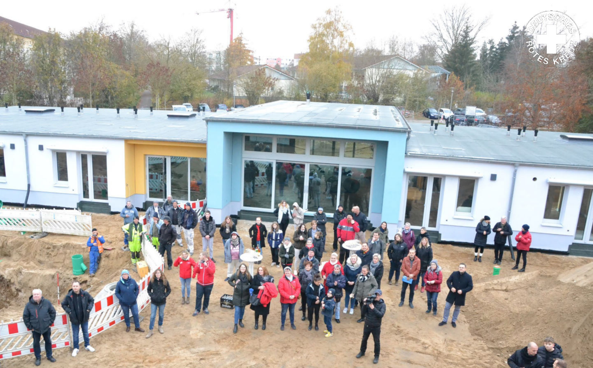
Richtfest der Kinder- und Jugend-WG sowie des Kinder- und Jugendnotdienstes im Güstrower Tolstoiweg.