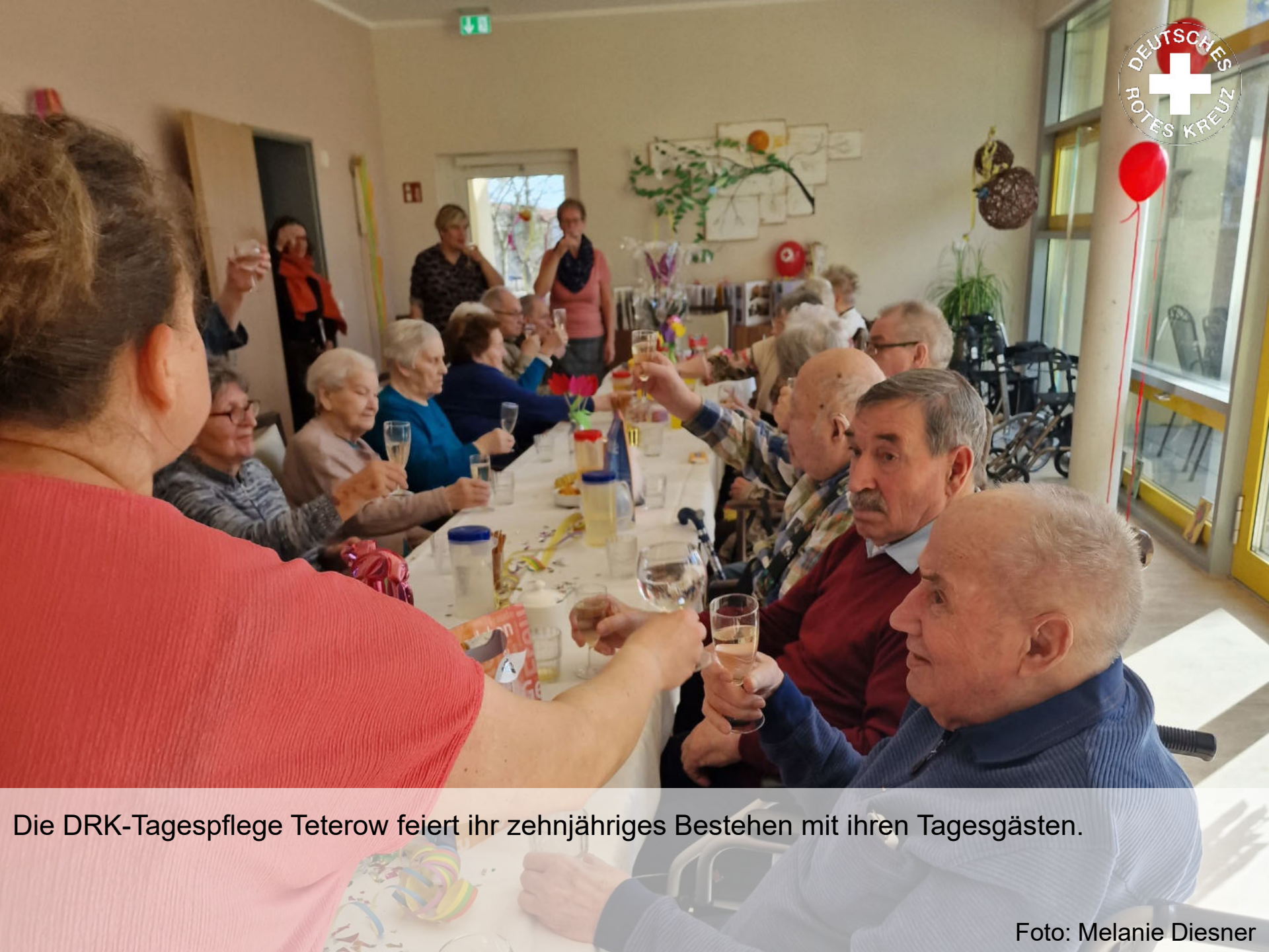
Die DRK-Tagespflege Teterow feiert ihr zehnjähriges Bestehen mit ihren Tagesgästen.