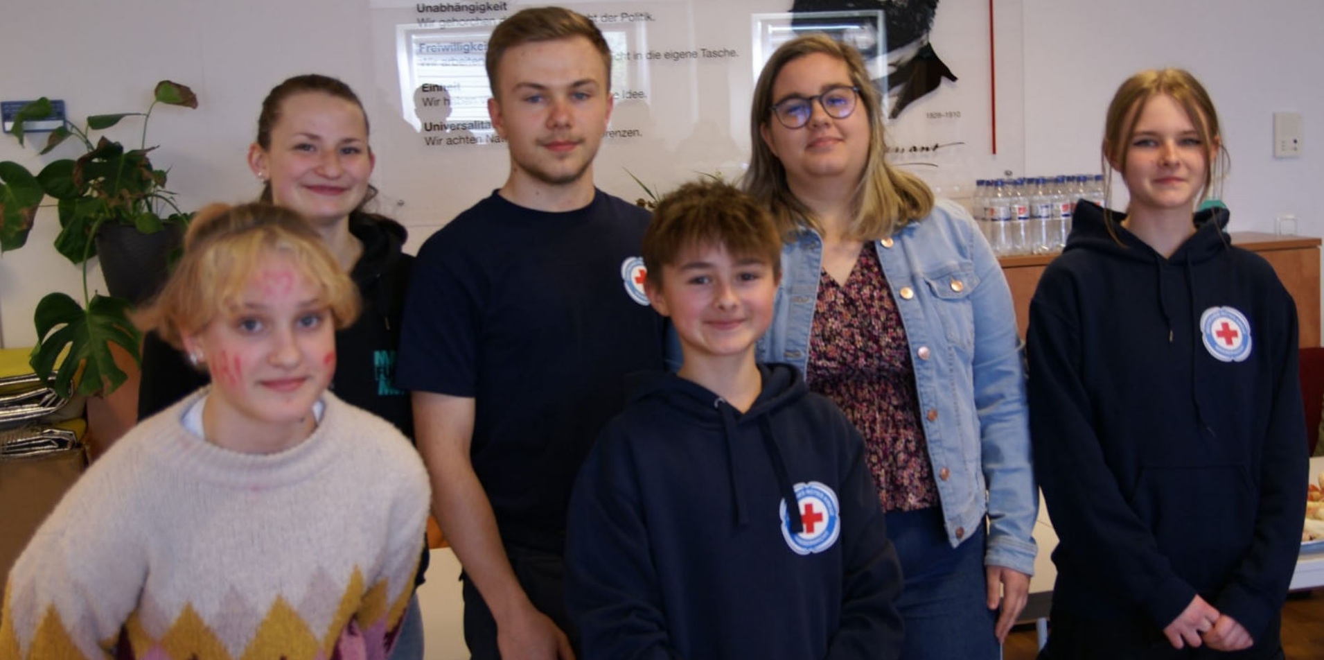
Jugendrotkreuz wählt neue Kreisleitung.