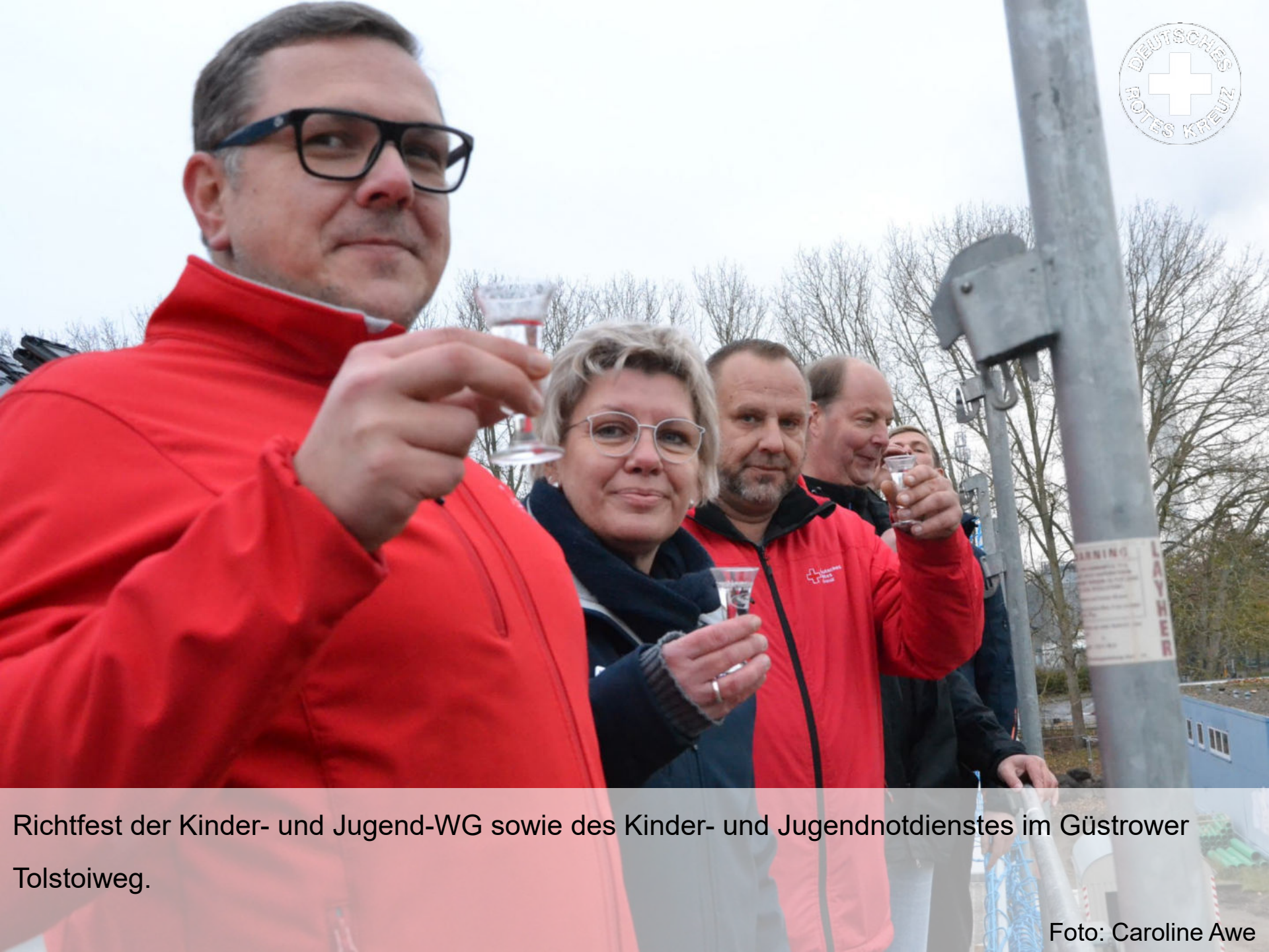
Richtfest der Kinder- und Jugend-WG sowie des Kinder- und Jugendnotdienstes im Güstrower Tolstoiweg.