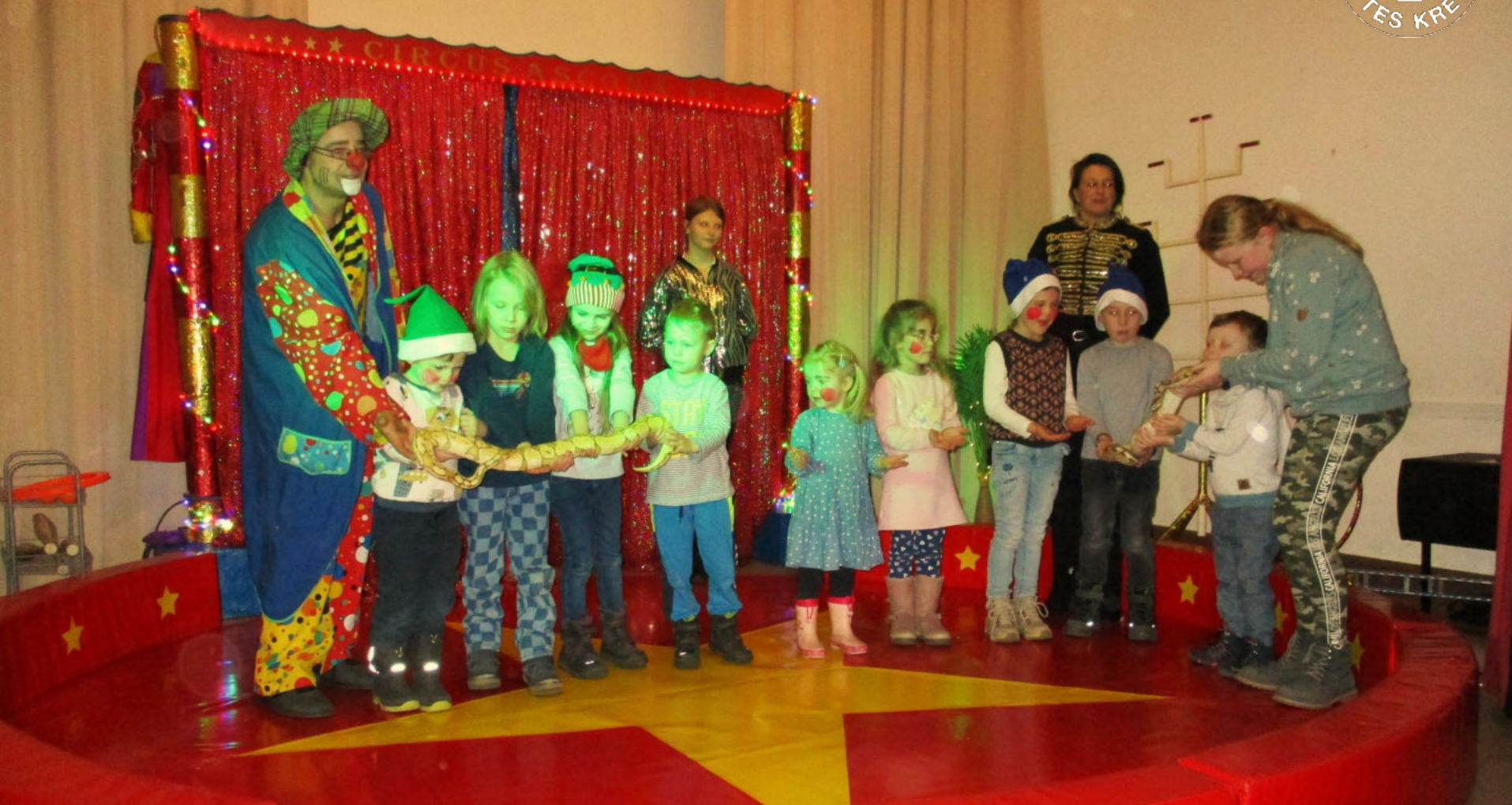
Die DRK-Kita Zwergenhaus begeht im Januar ihren 70. Geburtstag mit vielen Gästen und einem Mitmachzirkus.