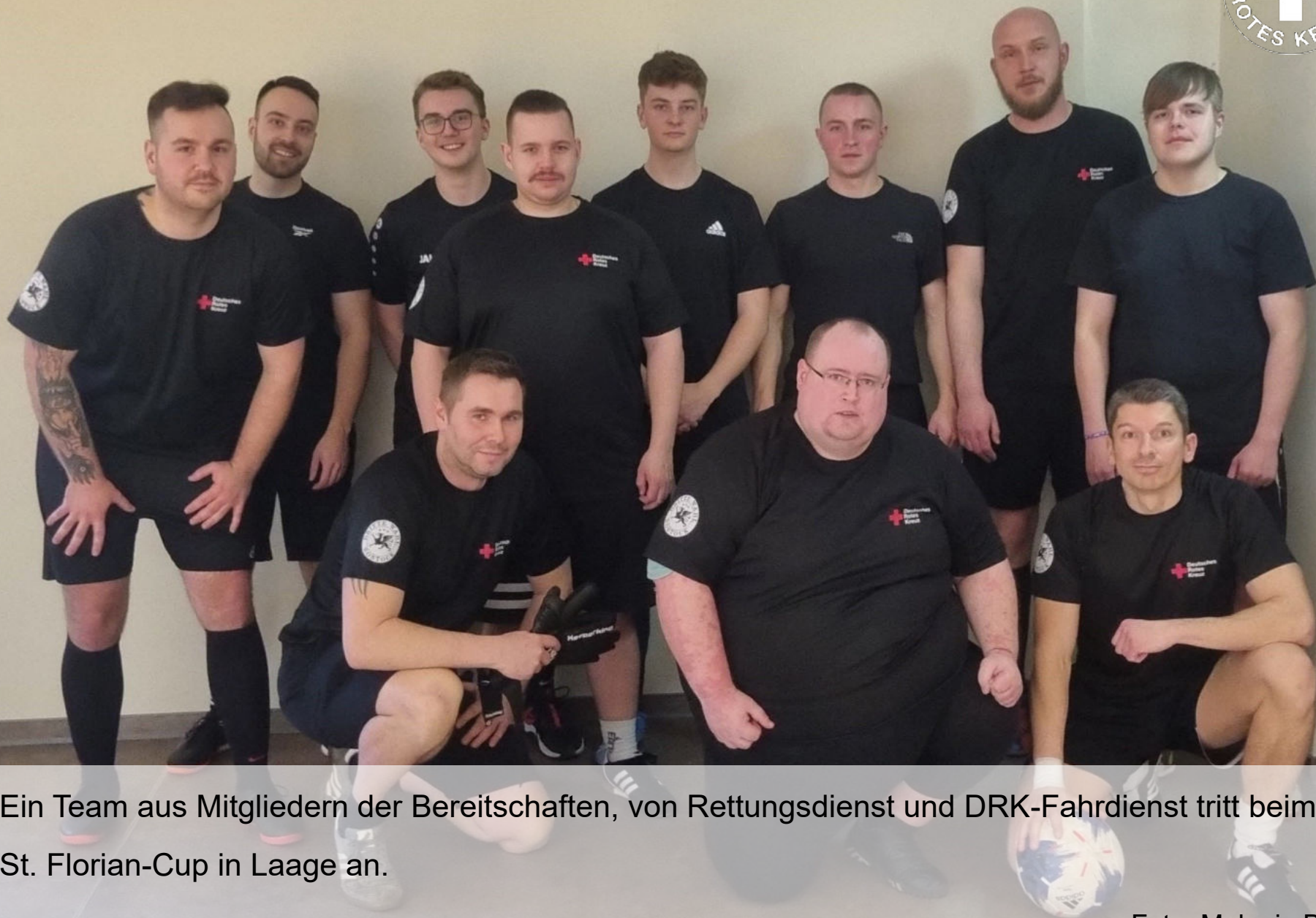
Ein Team aus Mitgliedern der Bereitschaften, von Rettungsdienst und DRK-Fahrdienst tritt beim 10. St. Florian-Cup in Laage an.