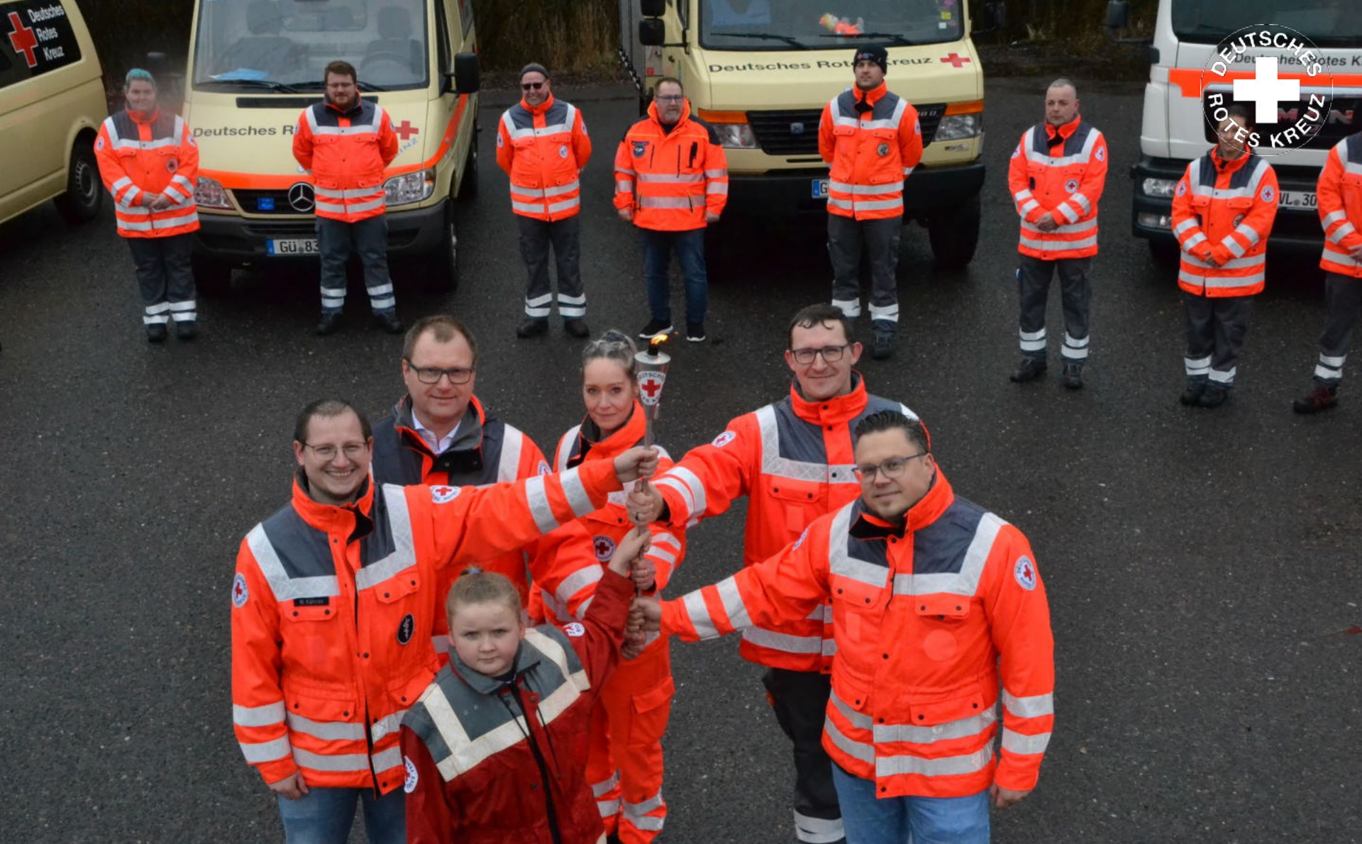
Teilnahme am Fackellauf nach Solferino im März 2023