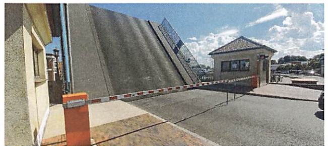
Die Schrankenanlage vor der Klappbrücke in Ueckermünde ist in die Jahre gekommen und birgt Gefahren.