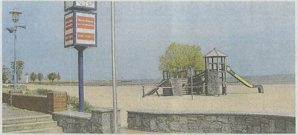
Auch an Kletterturm und Rutsche, wo sonst Kinder spielen, ist es in diesen Tagen fast immer ruhig.