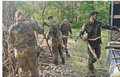
Frauen und Männer vom Jägerbataillon 413, das in Spechtberg stationiert ist, haben beim Umzug kräftig mitgeholfen.

Dass nicht nur die Erwachsenen zapacken können, haben auch etwa 20 Mädchen