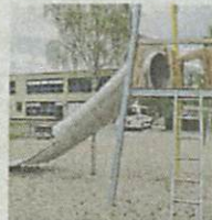
Eine neue Rutsche hat der Kita-Spielplatz bekommen.