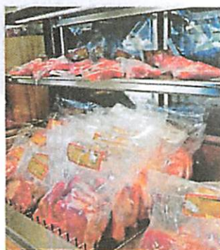
Schweinefilet, Kotelett und mehr machen jedes Mittagessen zum Genuss.