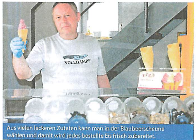
Aus vielen leckeren Zutaten kann man in der Blaubeerscheune wählen und damit wird jedes bestellte Eis frisch zubereitet.

hat in der Saison täglich von 11 bis 17 Uhr geöffnet . Jetzt im Sommer lädt nicht nur die liebevoll eingerichtete Scheune selbst zum Verweilen ein. Auch auf der Terrasse können gemütlich der selbst gebackene Kuchen oder eben jetzt auch das Eis genossen werden. Dabei