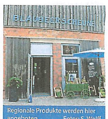
Regionale Produkte werden hier angeboten.

GWW Gemeinnützige Werk- und Wohnstätten GmbH