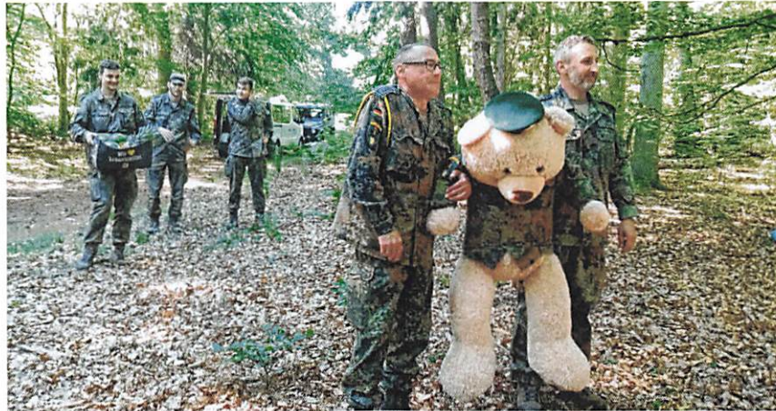
Überraschung für die Kinder: die Soldaten hatten Obst und Süßigkeiten für die Kinder dabei – und einen XXL-Teddy.

Dieser Ortswechsel war schon länger geplant, aber immer wieder wegen der Pandemie verschoben worden. Dass der Umzug nötig ist, darüber waren sich Bundeswehr, die Stadt Torgelow und nicht zuletzt Spechtberger Eltern und die Crew der Integrativen Kita „Sternschnuppe“ der Gemeinnützigen Werk- und Wohnstätten GmbH (GWW) einig. Der bisherige Waldspielplatz sei ohne Frage schön, aber wegen der Nähe zum Truppenübungsplatz auch gefährlich.