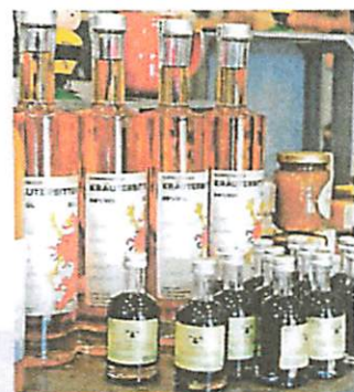
Auch verschiedene Liköre werden im Hofladen angeboten.