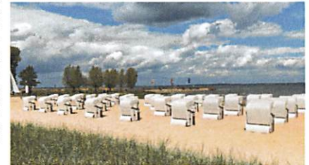
In Ueckermünde stehen die Strandkörbe in dieser Saison länger als in den Jahren zuvor.

Kontakt zum Autor c.johner@nordkurier.de