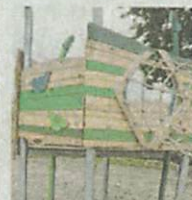
Das Koboldnest aus Holz ist bereit für die Kinder.

Leyla und Levy sind zwei der Kinder, die in dem fast kinderleeren Haus tagsüber betreut werden. Und eben nicht nur drinnen, sondern auch draußen. Dort konnten die Kita-Kinder in letzter Zeit die Handwerker genau beobachten. Einige haben allerlei neues Gerät auf dem großen Spielplatz gleich hinter der Kita aufgebaut, andere beispielsweise die Spiellokomotive auseinandergebaut, geschliffen, lackiert und dann wieder montiert.