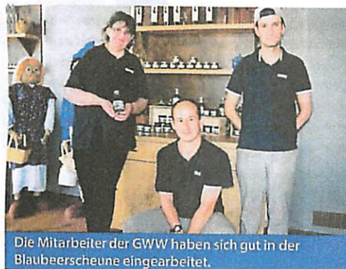
Die Mitarbeiter der GWW haben sich gut in der Blaubeerscheune eingearbeitet.