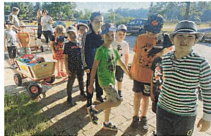
Die Jungen und Mädchen der Kita „Sternschnuppe“ zogen mit Bollerwagen durch den Wald.

Niemand wolle riskieren, dass den Kindern dort etwas zustößt.