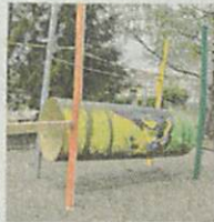
Freche Koboldgesichter zieren die Röhre auf dem Spielplatz.