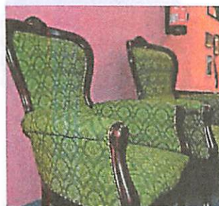
Solche antiken Schmuckstücke sind aktuell sehr gefragt. Hier steckt viel Arbeit drin.