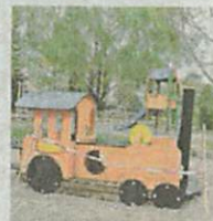
Die Lokomotive nach der Erneuerung.