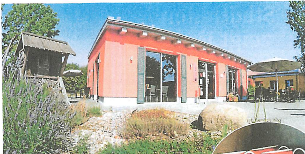
Dieser Hofladen in Woldegk hat viele Fans. Seit nunmehr sechs Jahren können Kunden dort Wurst und Fleisch aus eigener Produktion und viele regionale Köstlichkeiten mehr erwerben.

Hühner, Enten, Schafe und Schweine werden in Woldegk gehalten, vor Ort geschlachtet und verarbeitet. Die