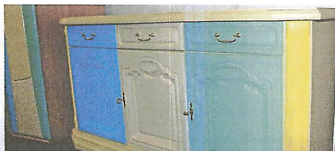
Manchmal kommt der Kunde schon mit ungewöhnlichen Vorstellungen. Die Mitarbeiter der Möbelbörse haben jedoch ihre Freude daran, auch mal richtig kreativ zu sein.