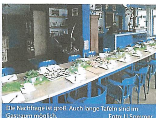
Die Nachfrage ist groß. Auch lange Tafeln sind im Gastraum möglich.