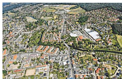
Sowohl kommunale als auch private Flächen für Wohnungsbau sind im Torgelower Baulandkataster zu finden. Der Überblick wird ständig aktualisiert, auch Privatleute können ihre Flächen einstellen lassen.

Allerdings ist die Finanzierung dieser Summe zum derzeitigen Stand noch nicht abgesichert, denn bis dato ist die Maßnahme nicht im Haushalt eingeplant. Deshalb entscheidet die Stadtvertretung am kommenden Donnerstag ab 17 Uhr im Bürgersaal über eine außerplanmäßige Ausgabe. Zuvor ist die Beschlussfassung auch Thema im Bauausschuss, der am Montag ab 16.30 Uhr im Bürgersaal tagt. Der Finanzausschuss hat bereits in dieser Woche über das Thema beraten und der Stadtvertretung ohne Diskussionen empfohlen, der Beschlussvorlage der Verwaltung zuzustimmen.