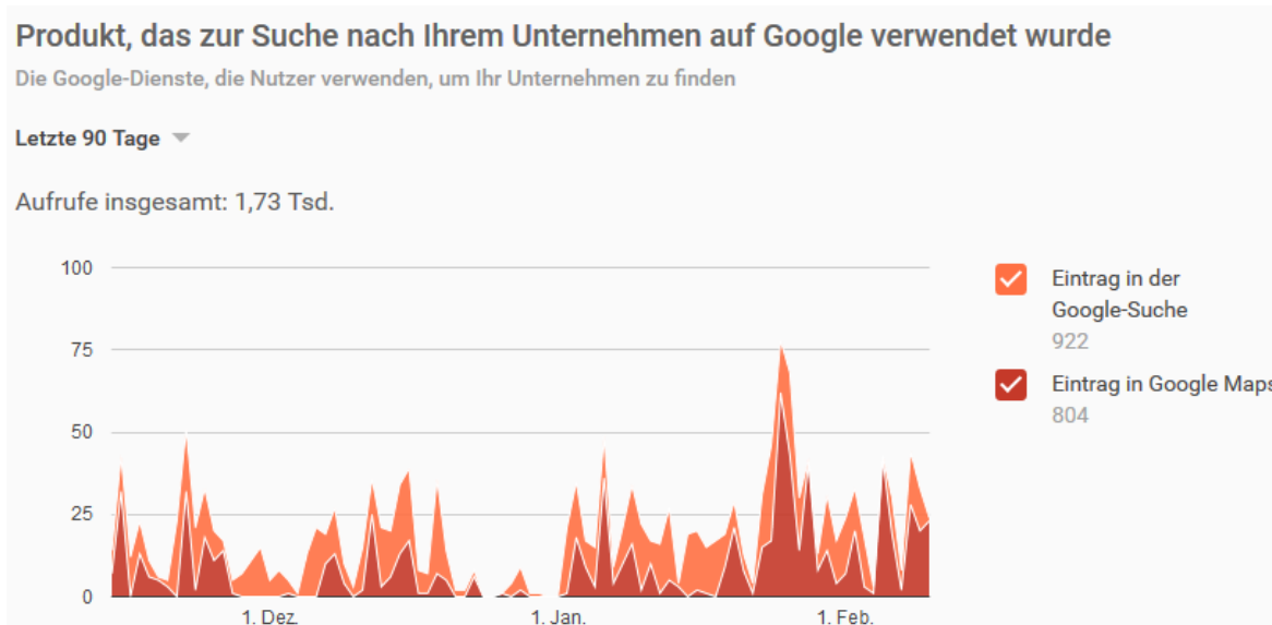
(Google My Business, Suche nach SchwalBe in Google Suche oder Google Maps; 18.05.2022)

Eine statistische Auswertung bietet auch Google My Business , die monatlich an die Hauskoordination gesendet wird oder bei Bedarf abgerufen werden kann. Hierbei ist zu erkennen, wie viele NutzerInnen nach der SchwalBe im Internet suchten und ob dabei die Google-Suche oder Google-Maps verwendet wurde. Im Vergleich zum Vorjahr des gleichen Quartals ist hierbei eine Konstanz zu erkennen.