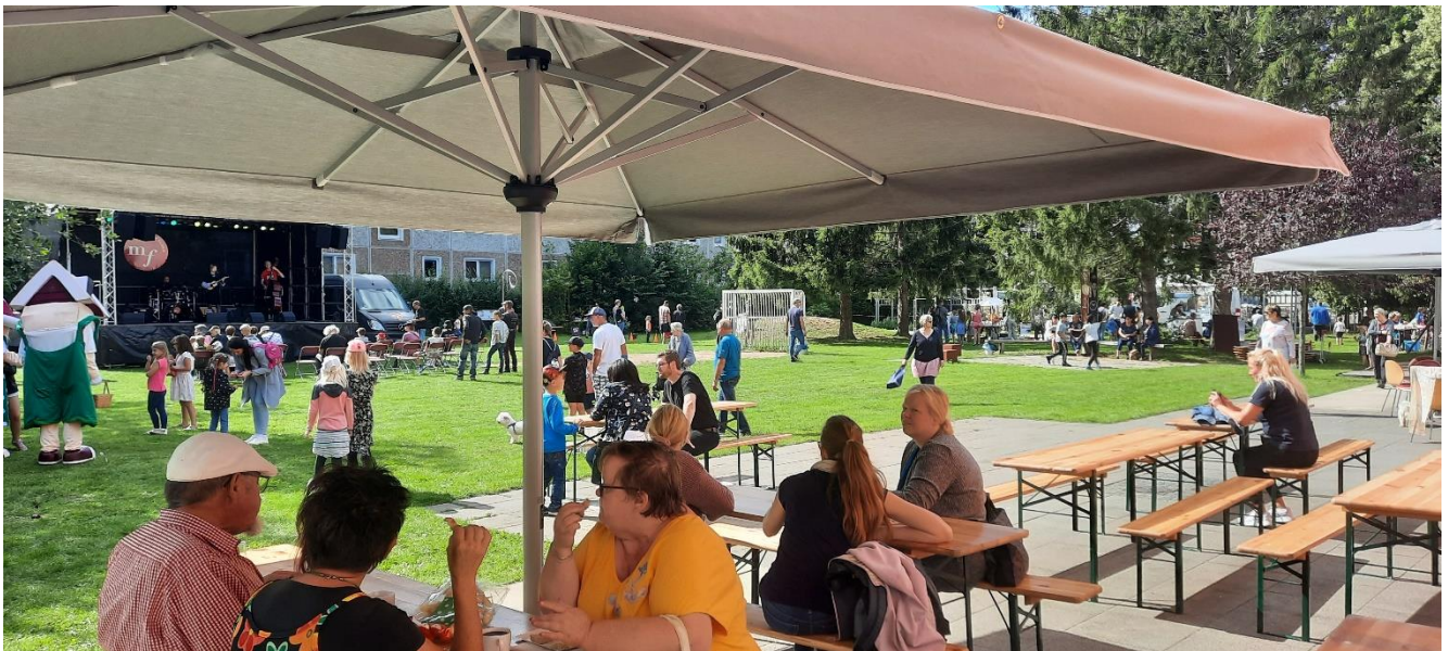
Stadtteilfest – September 2022

Der Kinderschutzbund KV Vorpommern Greifswald e.V. Maxim-Gorki-Straße 1 17491 Greifswald 03834 - 815497 hauskoordination@im-labyrinth.de