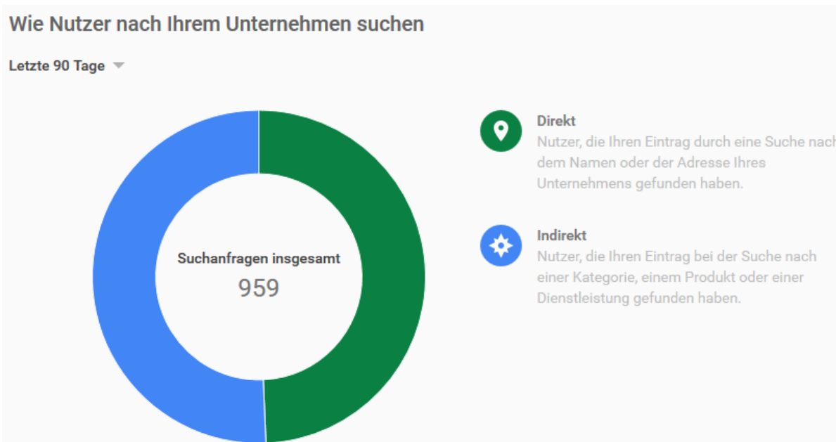
(Google My Business, Suchanfragen insgesamt, direkt und indirekt; 14.07.2022)